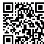
病児・病後児保育

病児・病後児保育Rainbow、一時預かり保育の詳細につきましては、専用パンフレットまたは、以下のQRコードより読み取れます。